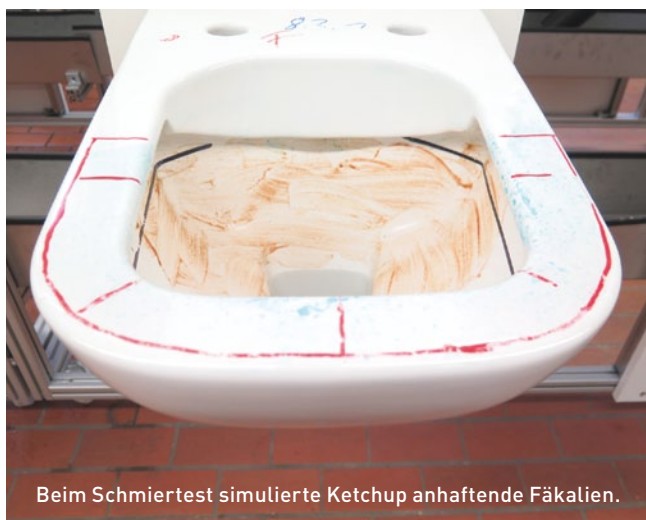
Beim Schmiertest simulierte Ketchup anhaftende Fäkalien.